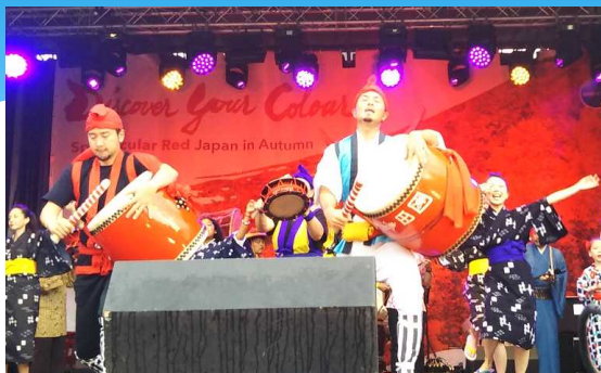
Actuación conjunta con los miembros de la Asociación Okinawense