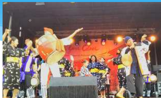
¡Gran final con kachashi!