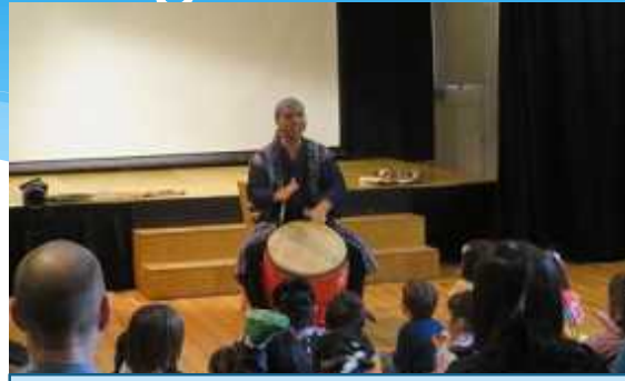
Niños de la escuela "Tulip London Eitoku Gakuen", experimentando música Okinawense