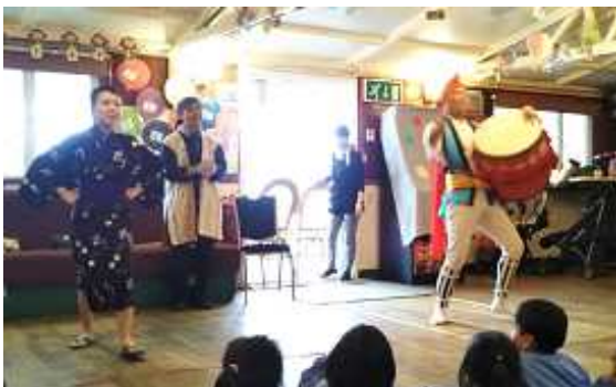
Niños de preescolar mirando fijamente la presentación de eisa de Sonda Seinenkai