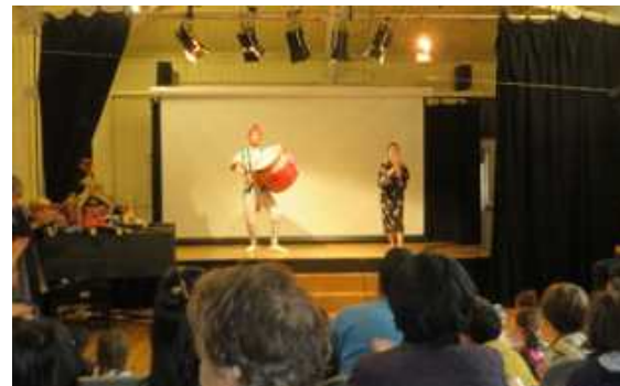
Embajadores transmitiendo la cultura Okinawense