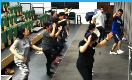
Instrucción de movimientos básicos de eisa a cargo del Sr. Takushi