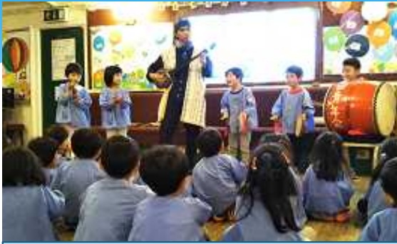
Niños del Jardín Infantil Cultural de Londres, tocando instrumentos musicales