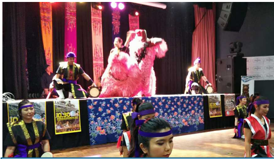
Participantes actuando junto a los especialistas de shishimai