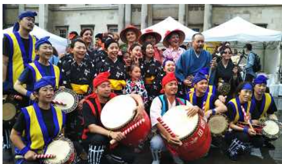
Integrantes mostrándose plenamente satisfechos luego de su actuación