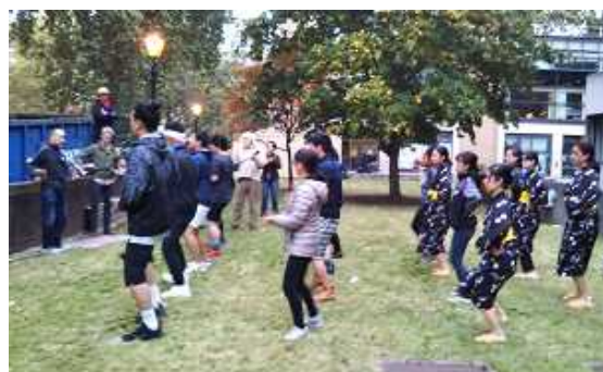
Ensayo de formación al aire libre previo a la presentación