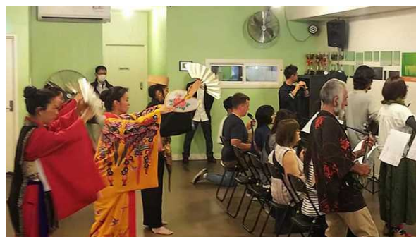
Especialistas y participantes tomando con seriedad las prácticas