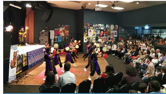
¡Espectadores fascinados con la presentación de Eisa !