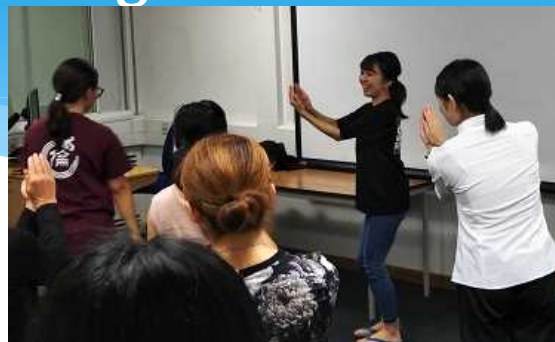
Participantes sumamente interesadas en los movimientos elegantes de las danzas femeninas