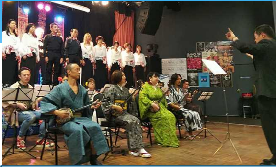
Tema Nada Sōsō a cargo del Coro Sakura y Sanshinkai