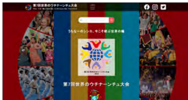
ホームページ (大会)