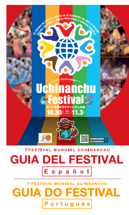
スペイン語・ポルトガル語