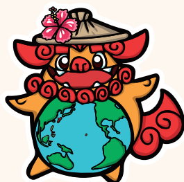
大会マスコットキャラクター「かさまる」 The mascot Kasamaru