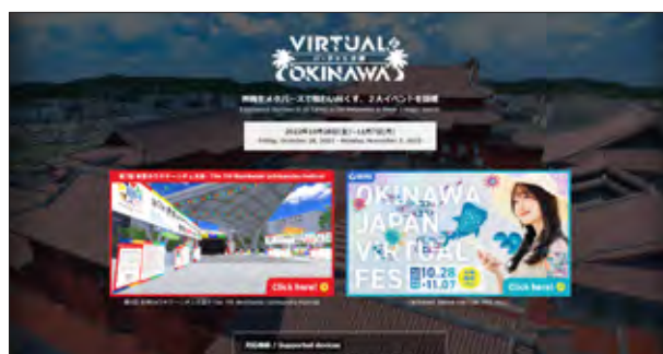
ホームページ (メタバース)